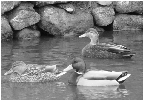
Sortbrun And ♂ med Gråand ♂ og ♀, Tórshavn 12/2 2003. American Black Duck .