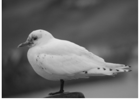
Ismåge 1K, Tórshavn 16/11 2004. Ivory Gull .

2004: 2.9-18.10, Hvannasund, Viðoy, *Hans Jørgen Nysted m.fl. (foto).