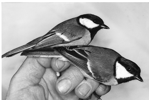
Musvitter, Nólsoy 2/5 2003. Great Tit.

Ny art for Færøerne og tilmed med en historie, der vakte opmærksomhed både i færøske og danske medier. De to fugle blev fanget samtidig i helgolandsfælden på Nólsoy. Den ene var allerede mærket i Bjergby på Vestsjælland som 1K 13/8 året før. Navngivne troværdige vidner beretter om to Musvitter på færgen Hanstholm-Lerwick-