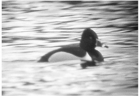
Halsbåndstroland ♂, Toftavatn 25/5 2003. Ring-necked Duck .