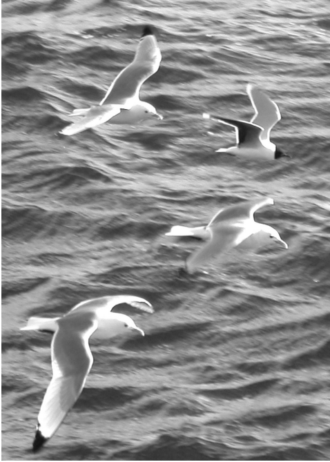
Dvergmåge med Rider, Nólsoy 24/5 2004. Little Gull .

25.5, Nólsoy bygd, Nólsoy, ad., *Jens-Kjeld Jensen m.fl. (foto).