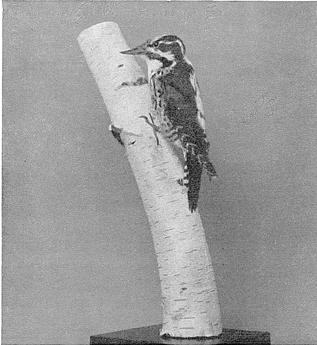
Tretaaet Spætte, Picoides tridactylus . ♀ juv. Uggerby Plantage ved Løkken 25. Marts 1942.

I Uggerby Plantage ved Løkken, hvor man ofte ser en Del Store Flagspætter samt undertiden Grønspætte, blev en ung ♀ af Tretaaet Spætte skudt paa nært Hold 25. Marts 1942, mens den var ivrigt optaget af at pille Insekter og Pup-der frem af Barken paa Træerne. Ved Konservatorens Hjælp