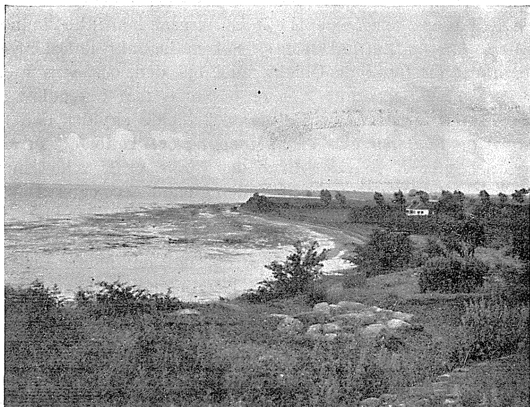
Fig. 1. Udsigt mod Øst fra Ravensborg, Nordvestlolland.