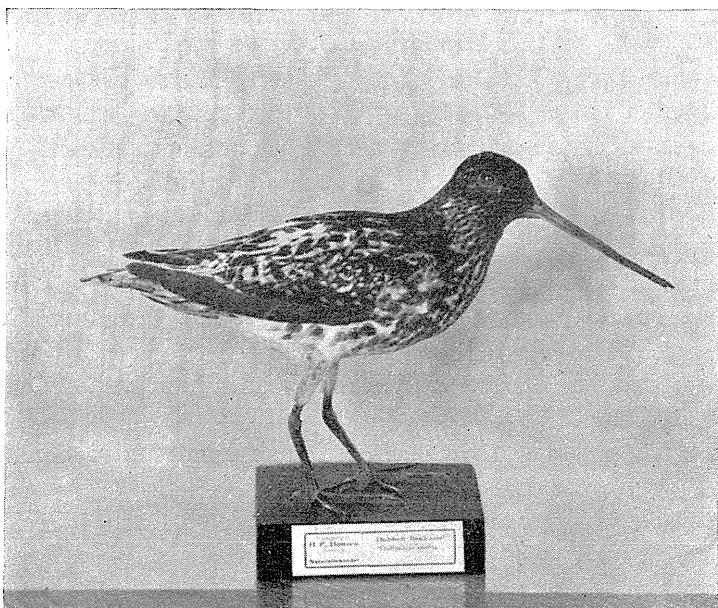
Fig. 1. Sort-hvid broget Dobbeltbökkasin ( Capella gallinago ).

Desuden findes et ejendommeligt Eksempplar af Dobbeltbökkasin, som i nogen Grad minder om den melanistiske