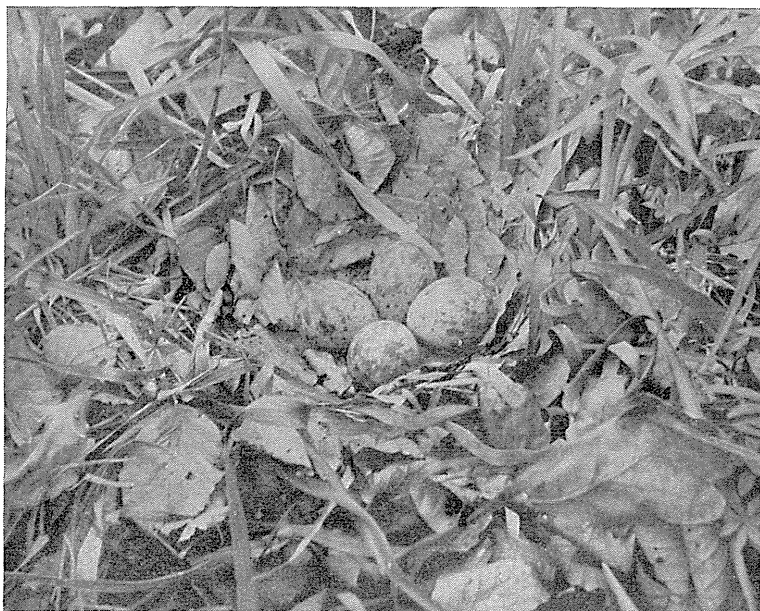
Rede af Skovsneppe, Rold Skov, Juni 1947.