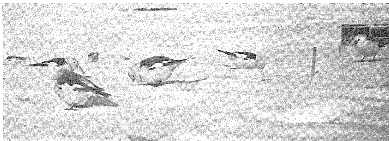
Fig. 2. Snespurve ( Plectrophenax nivalis ) ved Daneborg 4. maj 1955. H. ANDERSEN FOT.

var det bare hanner, som var her de første dage, og alle var fuldt udfarvede (fig. 2). Først nogle dage senere viste hunnerne sig og en del yngre fugle med mange rustrøde fjer. En Jagtfalk ( Falco rusticolus ) har også været her og foer omkring efter snespurvene.