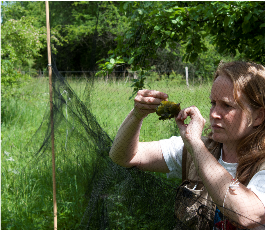
Ringmærkning ved Ravnstrup Sø.