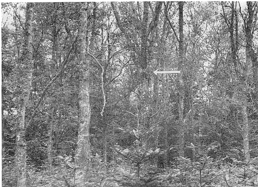
Fig. 1. Sjaggerens ynglebiotop i Nørholm skov ved Varde. Reden var bygget i egetræet midt i billedet (ved pilen). 1. juli 1965.

Fig. 1. The breeding habitat of the Fieldfare. The nest in the oak is indicated with an arrow.