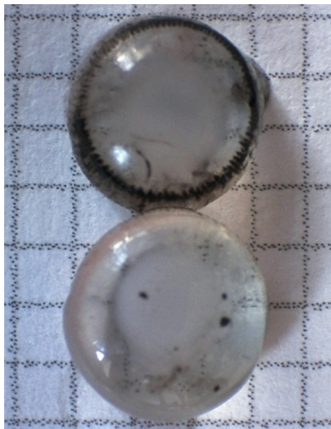
To linser fra en Spurvehøg hun med grå stær. Foto taget med mikroskop med computertilslutning. Forstørrelse 10×.

På grundlag af materialet – 350 optegnelser over fuglelinser fra 81 arter – analyserede Ismael Galván og Anders Pape Møller forekomsten af grå stær, med en ret så overraskende konklusion. Grå stær blev bl.a. konstateret hos Musvåge, Spurvehøg, Slørugle, Stor Hornugle, Ringdue, Bogfinke, Rødhals, Dompap, Vindrossel og Solsort. Det kan undre, hvordan fugle med grå stær kan overleve i naturen, og muligvis dør de da også efter kort tid. Det kan derfor tænkes, at vores materiale overvurderer frekvensen af grå stær. I alt blev grå stær fundet hos 13 arter, og disse havde et karakteristisk træk tilfælles, nemlig et pigment i fjerdragten kaldet pheomelanin. Dette pigment giver fjerene lysebrune, gulbrune, gule, røde eller orange-nøddebrune farver. Ved dannelsen af pheomelanin forbruges de