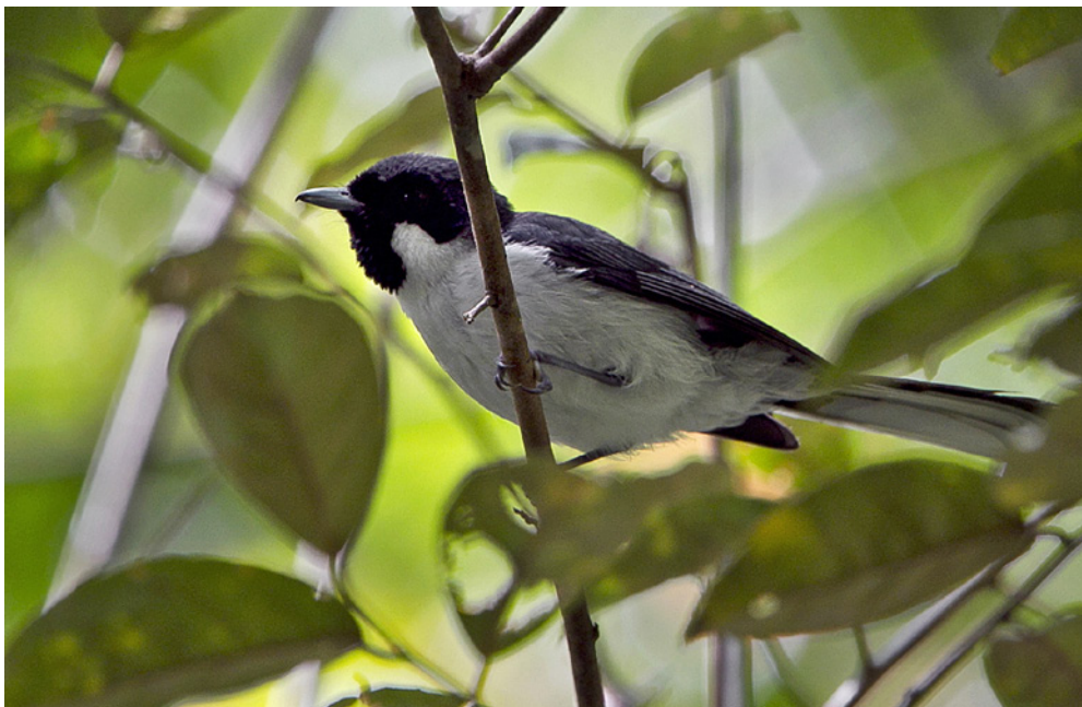
Den endemiske Floresmonark var blandt de arter, der udelukkende fandtes i den oprindelige skov på Flores.

ning er blevet konverteret til haver og småmarker. De sidstnævnte indeholdt små rismarker, og vegetationen var domineret af plantede træer, men der var også rester af den oprindelige vegetation. Hvert af de fire områder blev undersøgt intensivt i en uge, hvilket resulterede i 2746 identifikationer af 66 fuglearter.