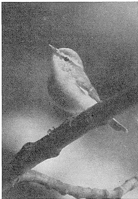
Fig. 3. Lundsanger ♂, Jydelejet, Møn, 2.6.71.