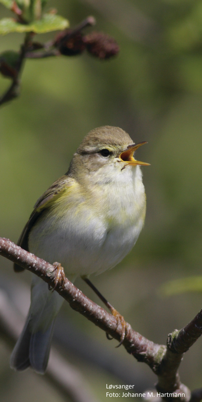
Løvsanger