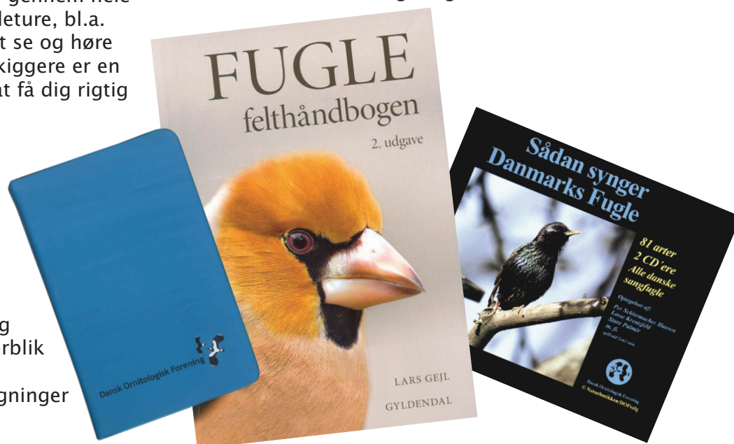
Notesbog med DOF-logo

En indspilning med fuglestemmer kan være rigtig nyttig. Med den kan du øve dig i stemmerne derhjemme, og du kan genlytte stemmer, når du er kommet hjem fra en fugletur, hvis du ikke er helt sikker på, hvad det er, du har hørt. Du kan også gå ind på www.dof.dk , hvor du kan høre stemmer fra og læse beskrivelser af nogle af de mest almindelige fugle i Danmark.