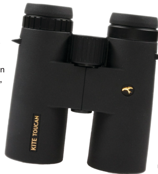
Kite Toucan 8x42

Til en førstegangskøber anbefaler vi gerne en 8x forstørrelse for at få den største succesoplevelse.