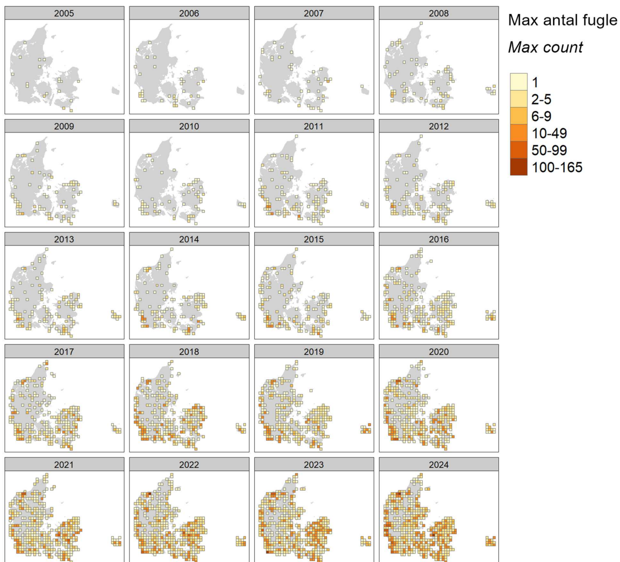
Fig. A1.2. Maksimumforekomster af Sølvhejre i Danmark pr. år i perioden 2005-24. Maximum annual numbers of Great Egret per year 2005-2024.